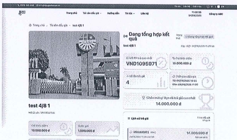
(Hình ảnh minh họa giao diện kết thúc phiên đấu giá)

Chỉ khi Đấu giá viên xác nhận kết quả là Đấu giá thành và công bố trên hệ thống đấu giá trực tuyến với trạng thái Kết quả đấu giá là Thành công , người có giá trả cao nhất mới được xác định và công nhận là Người trúng đấu giá.